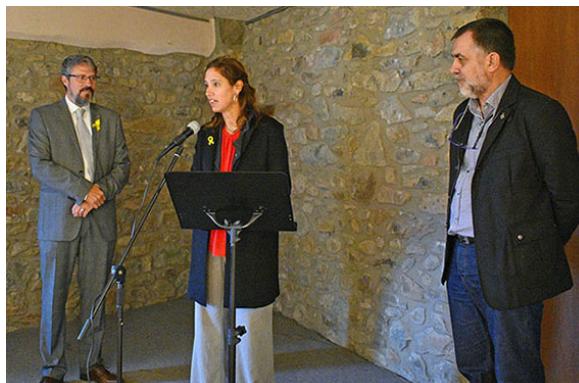
Parlament inaugural de la 17a Fira Medieval d'Oficis

Una altra de les celebracions destacades dels darrers mesos va ser l'Onze de Setembre, que va aplegar centenars de persones a la Torre. D'altra banda, la Casa de la Vila va acollir el passat 30 de novembre l'acte d'obertura de la Festa de Santa Bàrbara.