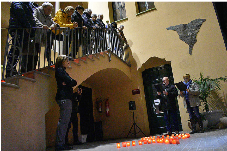
Lectura del manifest del Dia Internacional contra la violència envers les dones L'Ajuntament ha distribuït material de sensibilització als bars i restaurants de la vila

Súria es va adherir al Dia Internacional per l'eliminació de la violència envers les dones amb la celebració de la Setmana contra la violència de gènere. L'acte central va consistir en una encesa d'espelmes, la lectura d'un manifest a càrrec d'alumnes de l'Escola Municipal de Formació d'Adults i l'actuació d'un trio de l'Escola Municipal de Música.