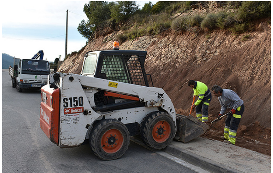
Neteja d'un marge a l'entorn de la carretera de Sant Salvador, al Poble Vell El manteniment i les reparacions a la via pública són una de les tasques fonamentals

► Tasques de manteniment i reparacions generals a la via pública,