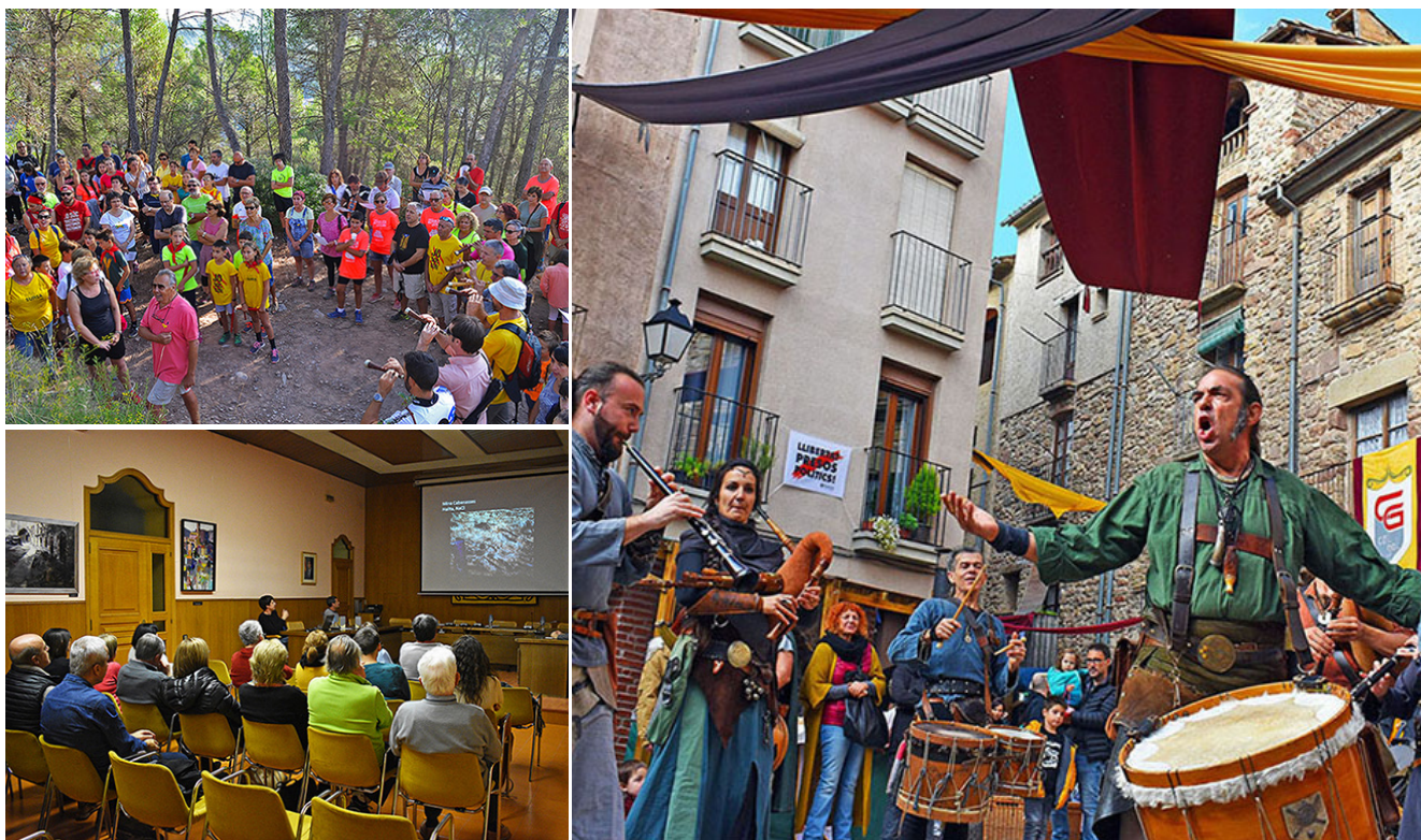
Actuació del grup musical Els Berros de la Cort a la plaça Major del Poble Vell durant la 17a Fira Medieval d'Oficis A l'esquerra, cant d'Els Segadors durant l'Onze de Setembre al Turó de la Torre i acte d'obertura de la Festa de Santa Bàrbara