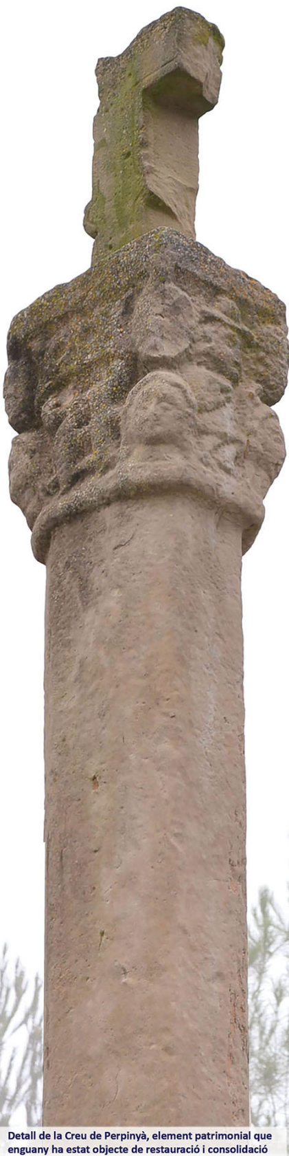
Detall de la Creu de Perpinyà, element patrimonial que enguany ha estat objecte de restauració i consolidació

Actes comunicats fins al dia 11 de desembre de 2018