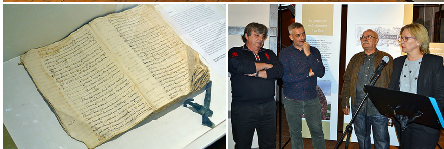
L'exposició ha estat impulsada per l'àrea de Cultura de l'Ajuntament de Súria Imatges de la mostra i de l'acte inaugural, que va tenir lloc a començaments de novembre