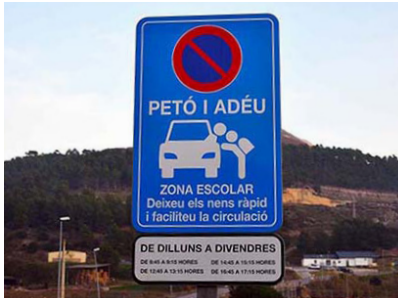
Rètol de la zona 'Petó i adéu'

Les àrees de Via Pública i Seguretat Ciutadana de l'Ajuntament han senyalitzat zones d'estacionament limitat 'Petó i adéu' a l'entorn de les escoles d'educació primària. L'objectiu d'aquesta iniciativa és escurçar el temps d'aturada de vehicles en els desplaçaments als centres.