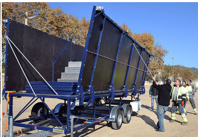
Oficina central de la Brigada d'Obres i Serveis a l'antic escorxador (esquerra) i procés de muntatge del nou escenari mòbil

públic i el manteniment general de les escoles Francesc Macià i Mare de Déu de Montserrat. Durant el cap de setmana funciona un equip de guàrdia per tal d'atendre les necessitats que es puguin produir en el conjunt del municipi.