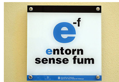
Placa de la campanya

Nou equipaments educatius, culturals i de lleure de la vila s'han adherit a la campanya 'Entorns sense fum' per prevenir l'inici del tabaquisme i l'exposició al fum ambiental de tabac entre infants i joves, amb la implicació dels adults. Una placa identifica els equipaments i serveis adherits. D'altra banda, el Casal de Joves ha acollit l'exposició itinerant 'El tabac al descobert'.