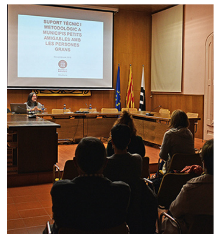
Presentació de les accions de la Xarxa

de les Persones Grans és una iniciativa de l'Organització Mundial de la Salut (OMS). L'elaboració del document comptarà amb el suport de la Diputació. D'altra banda, el passat mes d'octubre es va fer una nova edició de la Setmana de la Gent Gran amb diferents activitats sobre benestar i millora de la qualitat de vida, adreçades a aquest col·lectiu.