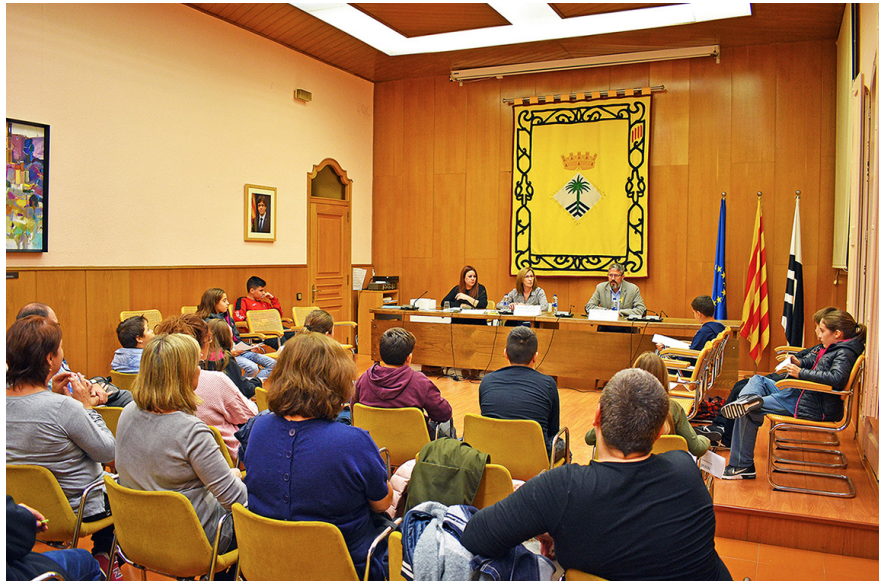
Acte de renovació parcial del Consell Municipal dels Infants a la Casa de la Vila L'òrgan de participació surienca va ser un dels primers que es va constituir al Bages

El Consell Municipal dels Infants de Súrria, un dels primers que es va crear al Bages, celebra aquest any 2018 el seu vintè aniversari. Les activitats d'aquest curs 2018-19 estaran centrades en el drama dels refugiats, segons es va anunciar durant l'acte de renovació parcial d'aquest organisme de participació. Seguint la línia de treball del Consell durant aquests vint anys, l'objectiu serà sensibilitzar l'alumnat de les escoles surienques sobre aquest