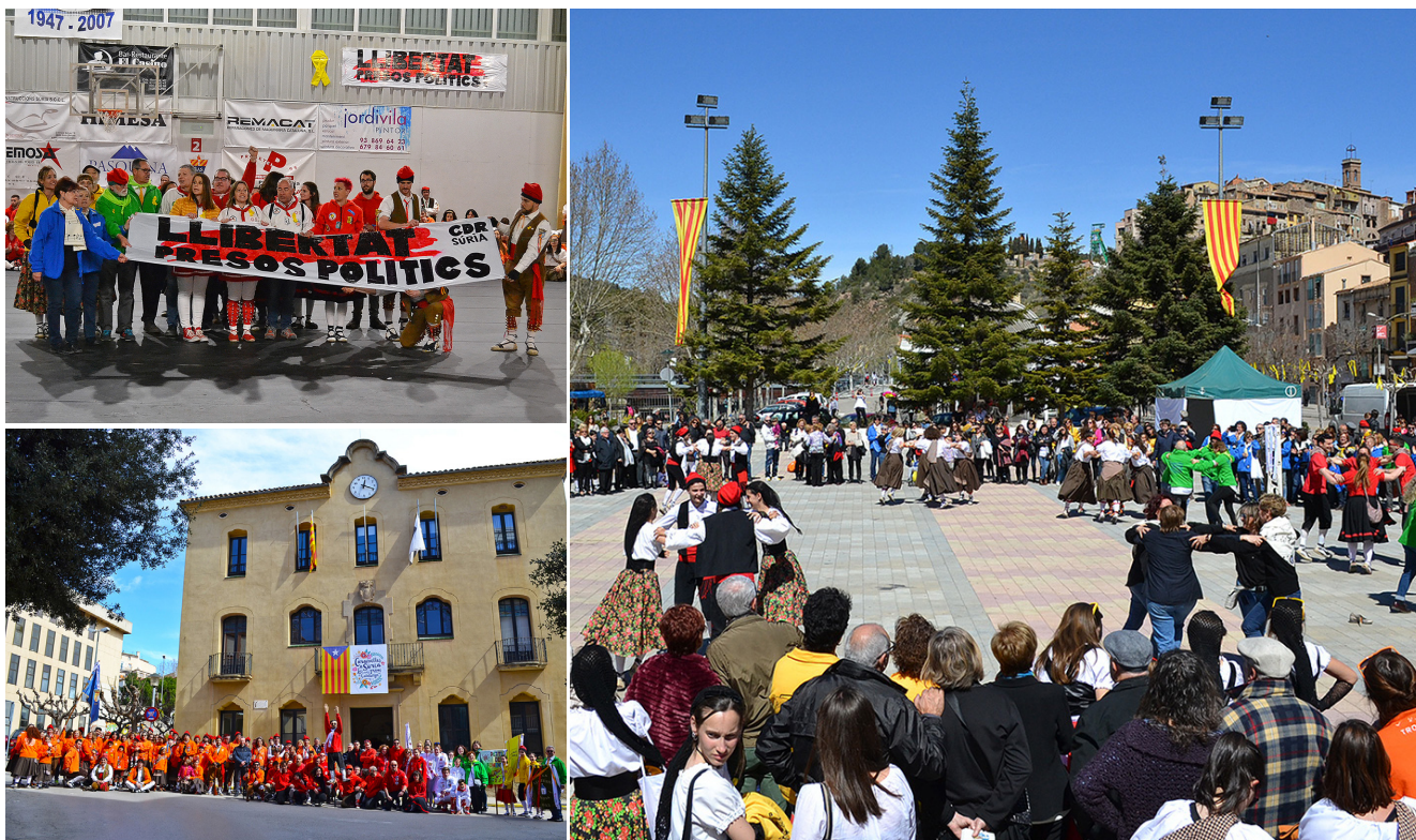
La cloenda de les Caramelles va tenir lloc Diumenge de Pasqua a la plaça de Sant Joan amb una ballada conjunta. Representants de les colles mostren la seva solidaritat amb els presos polítics (esquerra). A sota, participants en l'acte d'inici de la festa