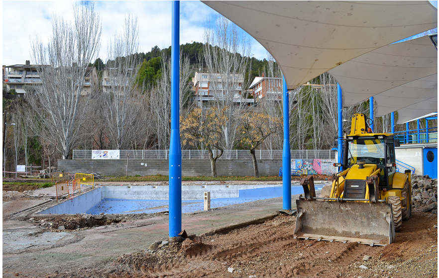
La nova fase de les obres de les Piscines es va iniciar el passat gener Les instal·lacions del recinte seran sotmeses a un procés de renovació general

Alumnes de cicle superior de les escoles de Súrria van participar el 7 de març en el Campionat Local d'Atletisme, que es va fer a l'estadi del Congost (Manresa). L'organització d'aquesta activitat va anar a càrrec de l'àrea d'Esports de l'Ajuntament, amb el suport de les escoles d'educació primària de la vila. La jornada del Campionat per a alumnes de cicle mitjà es va suspendre a causa del mal temps.