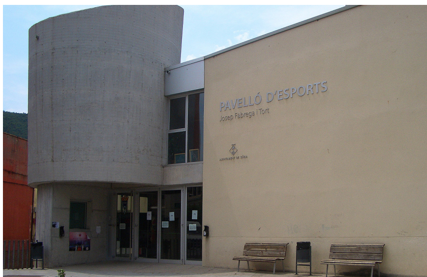
Imatge exterior del Pavelló Municipal d'Esports Josep Fàbrega i Tort La major part de l'estalvi energètic va provenir de les millores fetes en el recinte