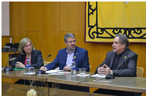
Imatge del prego de la Festa de Sant Sebastià