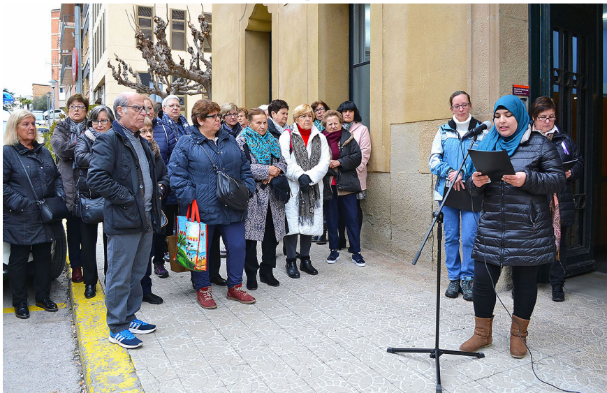
Lectura del manifest del Dia Internacional de la Dona davant la Casa de la Vila Alumnes de l'Escola Municipal de Formació d'Adults van llegir el text reivindicatiu

Súria va celebrar el Dia Internacional de la Dona amb la lectura d'un manifest al davant de la Casa de la Vila, una visita a Montserrat, una cadena humana i altres activitats a la plaça de la Serradora. La lectura del manifest va anar a càrrec d'alumnes de l'Escola Municipal de Formació d'Adults.