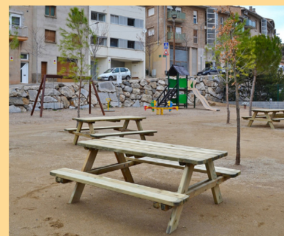
Imatge parcial del nou espai

El Poble Vell ja disposa d'una zona esportiva i de lleure a la carretera de Sant Salvador, amb el finançament dels pressupostos participatius de l'Ajuntament per a propostes de les associacions de veïns. Aquest nou espai públic compta amb una àrea de picnic, font, pista de petanca, mitja pista de bàsquet i parc infantil.