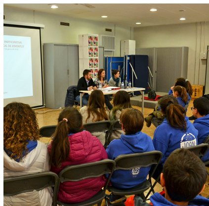
Imatge de l'acte al Casal de Joves

El Casal de Joves va acollir el passat 27 de gener una jornada participativa sobre l'elaboració del nou Pla Local de Joventut, que definirà les actuacions en l'àmbit jove entre els anys 2018-20. Dins dels treballs preparatoris del nou Pla, s'ha fet un estudi de diagnòstic sobre la situació i les necessitats del joventut de la vila, realitzat per l'àrea de Joventut de l'Ajuntament amb el suport de la Diputació de Barcelona.