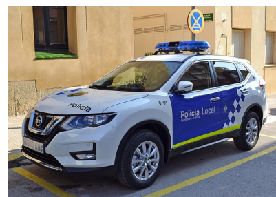
El nou vehicle de la Policia Local

A finals del passat mes de febrer va entrar en servei el nou vehicle de la Policia Local, dins del procés habitual d'actualització del material del cos policíac municipal. Pel que va a l'antic vehicle, la previsió és que serà utilitzat per a usos de la Brigada Municipal d'Obres i Serveis.