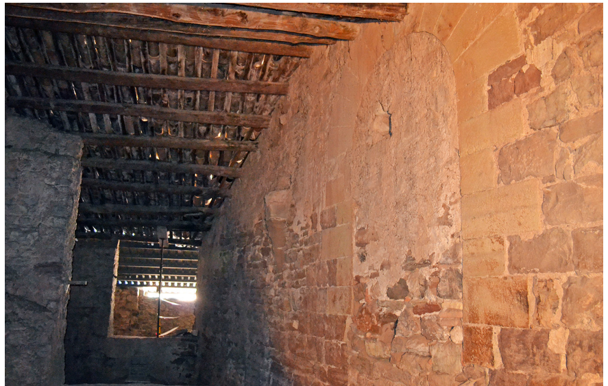
En primer terme, antic portal del Castell, que es recuperarà i s'obrirà de nou L'accés, tapiat des del segle XIX, es troba sota la coberta de la nau nord del temple