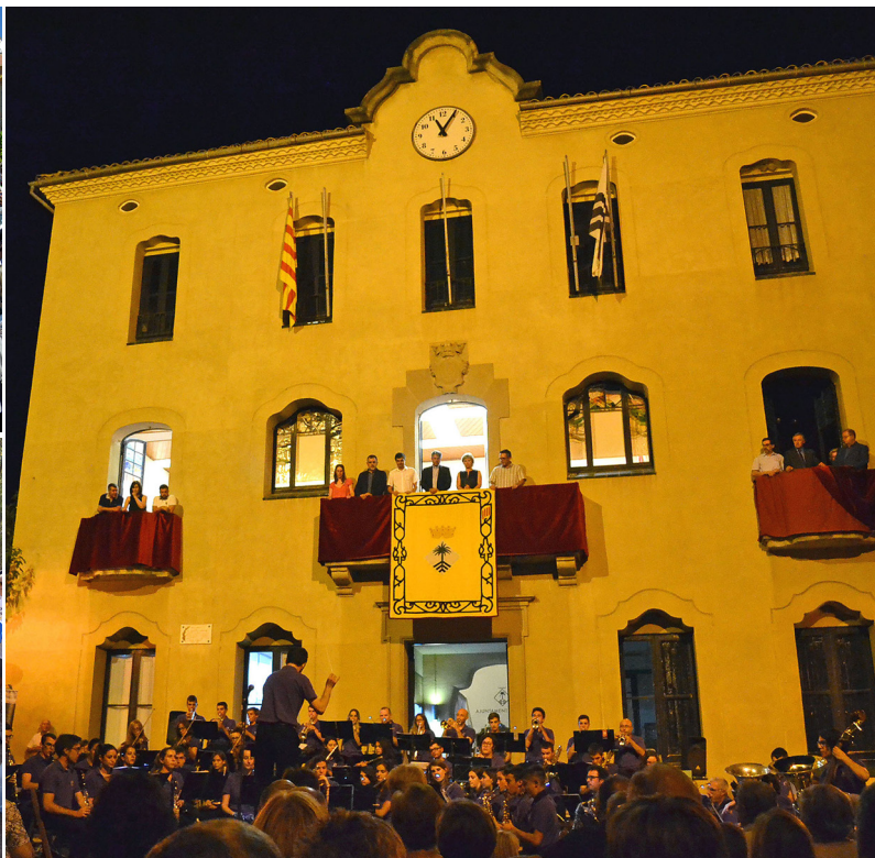
Les tradicionals Tocades de la Festa Major van tornar a omplir l'entorn de la Casa de la Vila durant la Festa Major. Les Caramelles de Súria van ser, un any més, les més grans de Catalunya (foto superior). A sota, acte central de l'Onze de Setembre.