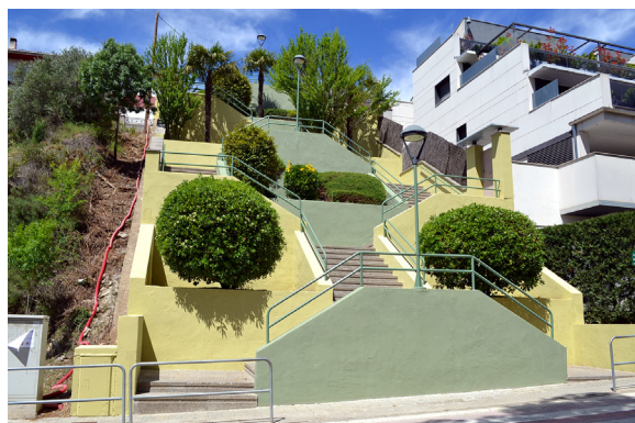
Repintat de l'escala d'accés al barri de Salipota

► Barri de Santa Maria: renovació del paviment i altres elements constructius de la pista poliesportiva (imatge de portada).