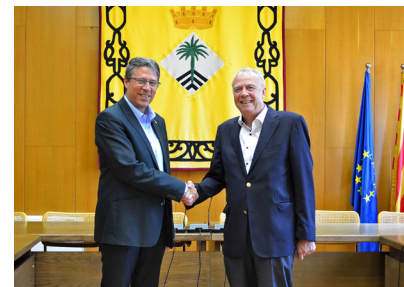
L'alcalde de Suria, amb el cònsol belga