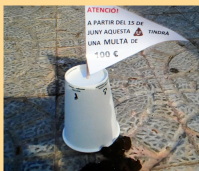
Element de la campanya informativa

La Policia Local ha imposat les primeres sancions per no recollir excrements de gossos al carrer, com a resultat de la implantació del cens genètic caní. Aquesta iniciativa de l'àrea de Medi Ambient de l'Ajuntament i de la Mancomunitat Intermunicipal del Cardener ha permès reduir dràsticament la presència d'excrements.