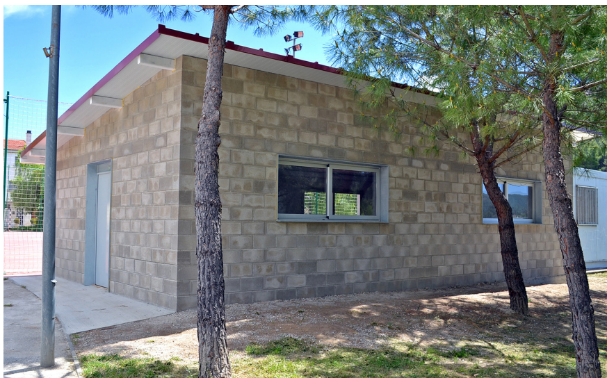
Local per a l'Associació de Veïns Sant Isidre-barri Joncarets, al costat de la pista

► Barri de Salipota: repintat de l'escala d'accés al barri.