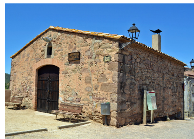
La Ferreria de l'Era del Castell

L'Ajuntament ha portat a terme actuacions en tres edificis del Poble Vell, dos dels quals municipals, per a la reparació de diferents danys detectats. Una d'aquestes actuacions va comportar l'enderrocament d'una tribuna de construcció moderna en un immoble de propietat privada al carrer de la Mura, a causa de l'alumini. Atès l'estat general d'aquest immoble, també va ser necessari desallotjar els inquilins. Les altres actuacions han estat iniciades a la coberta de la Ferreria i a l'edifici de Can Ton Bató. Pel que fa a aquest darrer immoble, s'han començat a fer gestions amb altres administracions per tal d'estudiar l'abast de l'actuació.