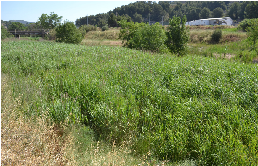
Les actuacions previstes volen donar resposta als problemes d'aquest entorn En els propers mesos s'hi faran diferents activitats participatives i adreçades a tothom