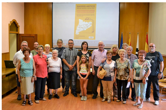
Acte de lliurament dels premis de la campanya comercial

en els darrers mesos. Les Caramelles d'enguany han consolidat la xifra rècord de nou-cents participants i s'han mantingut un any més com les més grans de Catalunya. Pel que fa a l'Onze de Setembre, la Nit de Sant Joan i a la diada de Sant Jordi, també van mantenir les xifres de participació d'anys anteriors.