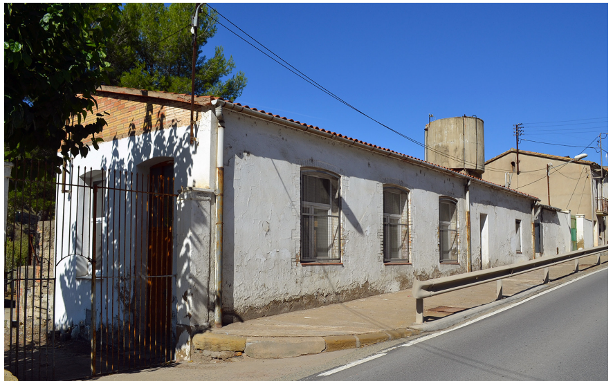
L'antic edifici escolar del barri de Fusteret ha estat objecte de millores

Arran d'un acord entre l'equip de govern (CiU, ERC i aiS) i el grup municipal del PSC, l'any 2016 es va posar en marxa aquesta experiència de pressupostos participatius que preveu destinar cada any, durant tot l'actual mandat, 90.000 euros per a actuacions proposades per les associacions de veïns. Per tant, la inversió total d'aquests quatre anys en pressupostos participatius serà de 360.000 euros. La iniciativa va ser presentada a totes les associacions de veïns de la vila. Cada entitat veïnal pren la decisió sobre l'actuació que consideri més necessària al seu barri amb plena autonomia, ja sigui mitjançant una consulta al veïnat o qualsevol altre sistema.