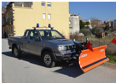
Nova pala llevaneus de l'ADF

L'Agrupació de Defensa Forestal (ADF) Defensors del Bosc ha incorporat a la seva dotació tècnica una pala llevaneus que pot ser acoplada al vehicle d'aquesta entitat i també a d'altres vehicles de serveis. Aquesta millora facilitarà la neteja de la via pública en casos de nevades intenses.