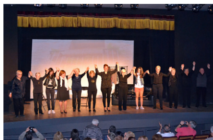
Final de l'obra teatral 'Escenes amb tracte'

i l'obra teatral 'Mars Joan' del surienc Roc Esquiús. Aquest espectacle teatral també formava part del nou cicle 'Art en Cicle'.