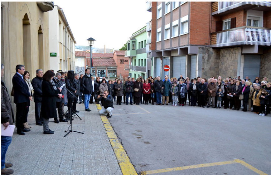
Concentració contra la violència de gènere, al davant de la Casa de la Vila L'Ajuntament va declarar un dia de dol oficial pel tràgic fet esdevingut a Súria

Súria ha mostrat el seu compromís per la igualtat entre homes i dones i el rebuig a la violència de gènere. El 8 de febrer, unes tres-centes persones van participar en una concentració davant la Casa de la Vila com a mostra de dol pel tràgic fet esdevingut el dia abans a la vila.