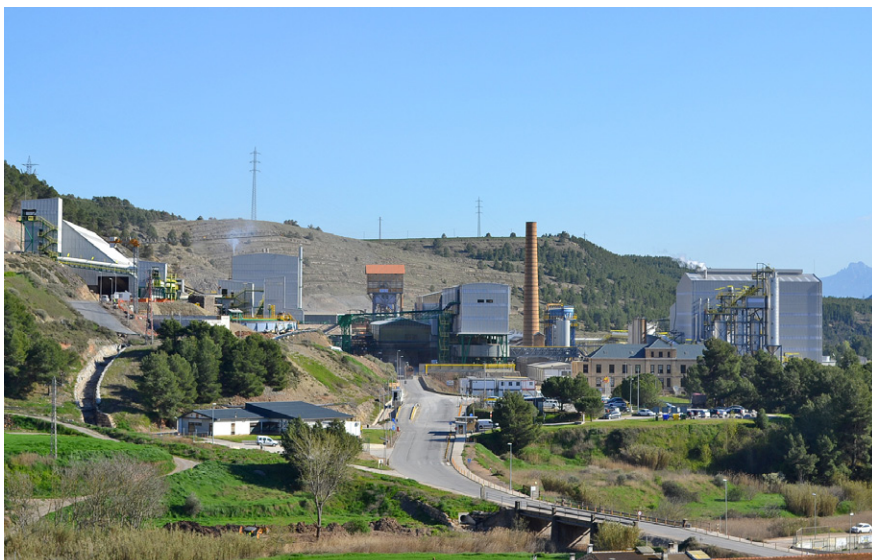
Instal·lacions centrals de l'empresa minera Iberpotash-ICL a Súria

La corporació ha aprovat per unanimitat una moció per a la continuïtat del sector