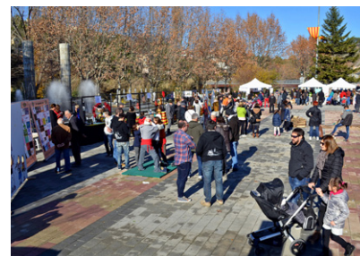
Imatge de la 2a Fira d'Entitats

La segona edició de la Fira d'Entitats es va celebrar el passat 18 de desembre, coincidint amb la Fira de Nadal. La Fira d'Entitats és organitzada per l'àrea de Cultura de l'Ajuntament per donar a conèixer les activitats del teixit associatiu de la vila. La plaça de Sant Joan va acollir la majoria d'actes.