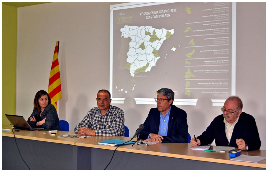
Roda de premsa per presentar el nou sistema d'identificació dels gossos La iniciativa està liderada per la Mancomunitat Intermunicipal del Cardener

Fins al 31 de maig d'enguany, les extraccions de sang es poden fer sense cost per als propietaris. Amb posterioritat a aquest termini, les extraccions aniran a càrrec dels propietaris i hauran de ser realitzades per veterinaris acreditats. La inscripció dels animals en aquest cens