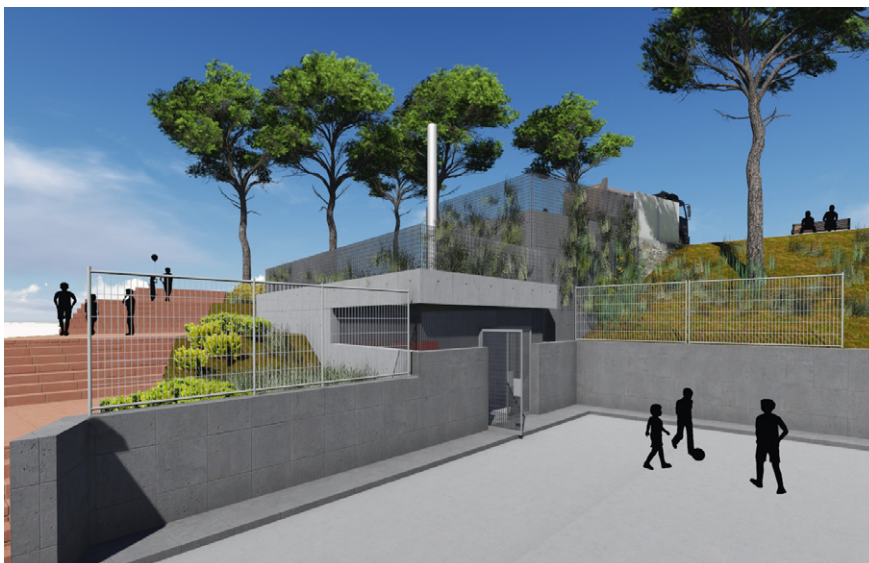
Imatge del projecte, que permetria assolir un estalvi mitjà del 53%

Representants del teixit associatiu de la vila van assistir el passat 19 de desembre a una nova sessió informativa sobre les obligacions fiscals i econòmiques de les entitats. L'acte va ser organitzat per l'Ajuntament. El desenvolupament del tema va anar a càrrec de l'entitat manresana CAE.