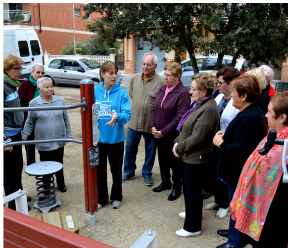
Presentació de l'espai lúdic i de salut de Salipota L'atenció a les persones grans, una responsabilitat social

Una de les grans prioritats de l'actual equip de govern ha estat el reforçament de les polítiques d'atenció social per garantir la cohesió social i minimitzar els efectes de la crisi entre persones i famílies desfavorides. L'àrea de Benestar Social ha mantingut una col·laboració permanent amb Càritas Parroquial i ha donat suport al naixement i consolidació de l'Associació de Voluntaris. Des de l'any 2012, aquesta nova entitat aplega els esforços de persones i entitats de la vila a través de les seves dues línies de treball, Aliments Súria i Infants Súria, que es desenvolupen habitualment en instal·lacions municipals. A més de col·laborar amb el voluntariat de la vila, la regidoria de Benestar Social ha treballat conjuntament amb altres àrees municipals per tal d'impulsar iniciatives adreçades a diferents col·lectius.