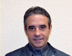
PIUS BADIA I PONS