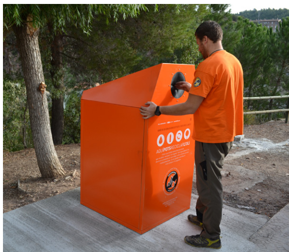
Instal·lació d'un dels nous contenidors d'oli usat La sostenibilitat requereix la participació de tothom

La creació del Consell Municipal de Medi Ambient i del mercat de segona mà Suria-trastos han estat dues de les iniciatives destacades de l'àrea de Medi Ambient per coordinar els esforços de les persones i entitats que treballen en aquest àmbit i per estendre la sensibilització per la sostenibilitat, el reciclatge i la protecció de l'entorn.