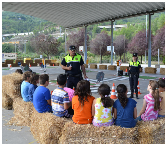
Xerrada de seguretat viària per a escolars de la vila La Policia Local participa en la Setmana de la Mobilitat

La principal tasca de la Policia Local és vetllar pel compliment de les normes bàsiques de respecte i convivència en els diferents àmbits de la vida social. Per aquest motiu, les seves intervencions engloben una varietat molt gran de situacions, com l'auxili a les persones, la mobilitat urbana, el control de vehicles, les denúncies ciutadanes o les infraccions de trànsit, entre d'altres supòsits. En casos d'emergència, la Policia Local treballa conjuntament amb altres cossos, com els Mossos d'Esquadra o Protecció Civil. Al costat d'aquestes actuacions, que representen el gruix principal de la seva activitat, la Policia Local també desenvolupa accions de sensibilització i informació sobre temes de seguretat per a diferents col·lectius de la vila, especialment el sector comercial o les persones grans.