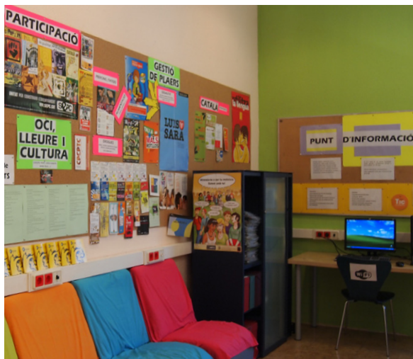
Interior de l'oficina del Punt d'Informació Juvenil El Pla Local de Joventut definirà les línies de futur

Al llarg del curs escolar es fan nombroses activitats informatives adreçades als joves a través del Punt d'Informació Juvenil (PIJ) i el Programa d'Informació i Dinamització (PIDCES), que té el suport de la Diputació. Des de l'any 2013, el Casal de Joves acull una oficina permanent del PIJ, que ofereix als joves informació i assessorament personalitzat, gratuït i confidencial.