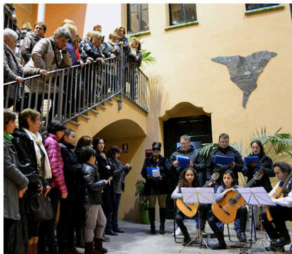
Lectura del manifest contra la violència de gènere La sensibilització social és necessària per eradicar-la

L'activitat de l'àrea d'Igualtat es concentra d'una manera destacada en les celebracions del Dia Internacional de la Dona (8 de març) i del Dia Internacional contra la violència envers les dones (25 de novembre). Al voltant d'aquestes dues dates es desenvolupa un programa d'actes que en els darrers anys ha comptat amb la participació de dones tan conegudes com sor Lucía Caram o la historiadora Assumpta Montellà. En l'organització d'aquestes acti-