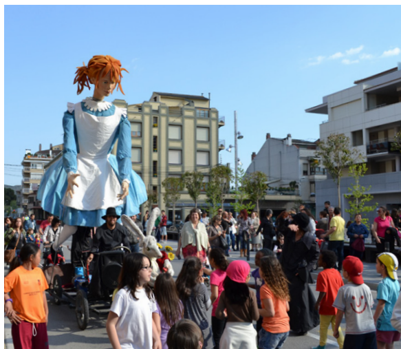
Acte participatiu durant la diada de Sant Jordi El programa Sùria Municipi Lector ha promogut la lectura

En els darrers anys, la zona de les Guixeres ha estat l'escenari de la Campanya d'Excavacions Arqueològiques, que ja ha arribat a la desena edició amb la col·laboració de l'institut Mig-Món i estudiosos locals. Aquests treballs han permès treure a la llum importants troballes medievals que confirmen el gran interès històric d'aquest jaciment. També ha estat rehabilitat el monument a Josep Anselm Clavé, un element emblemàtic de l'espai públic surienc. L'Ajuntament ha seguit donant