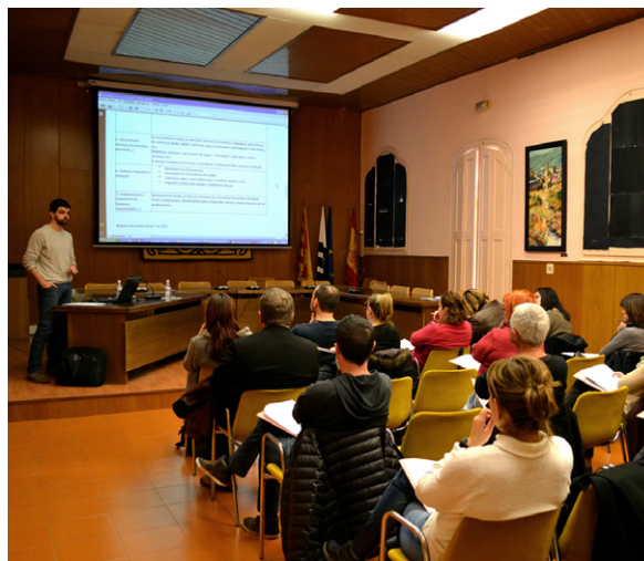
Seminari sobre les empreses i les xarxes socials La formació és bàsica per guanyar competitivitat

Una altra activitat destacada han estat les dues edicions del programa 'Treball als barris', adreçat específicament a persones residents als