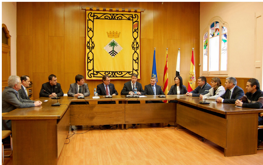
Recepció institucional al President de la Generalitat en la seva visita a Súria Artur Mas va ser a la vila el gener de 2012 per presidir un acte sobre el pla Phoenix

L'esmentada reducció d'ingressos ha limitat les possibilitats d'inversió directa per part de l'Ajuntament i no ha permès desenvolupar grans projectes d'equipaments culturals i