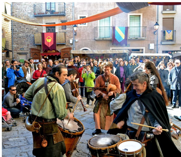
La Fira Medieval d'Oficis atreu milers de visitants El patrimoni històric i geològic té un gran potencial

L'Ajuntament manté la seva aposta pel potencial turístic de la vila, però la necessitat d'optimitzar els recursos dels serveis municipals ha por-