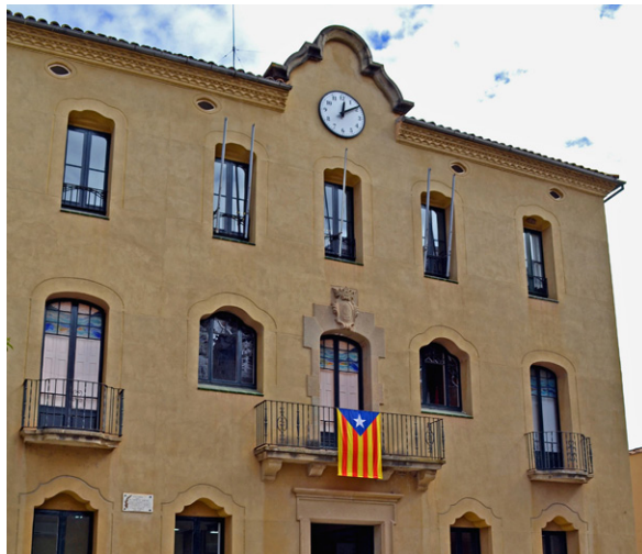
La Casa de la Vila, seu institucional i administrativa La major part dels tràmits es podran fer a través d'internet

L'Ajuntament de Súria ha posat les bases per al desenvolupament de l'administració electrònica, que en un futur permetrà fer la major part dels tràmits municipals a través d'internet. Des de l'any 2013 també s'està procedint a la digitalització de tots els expedients municipals, un pas necessari per avançar cap a aquest objectiu.