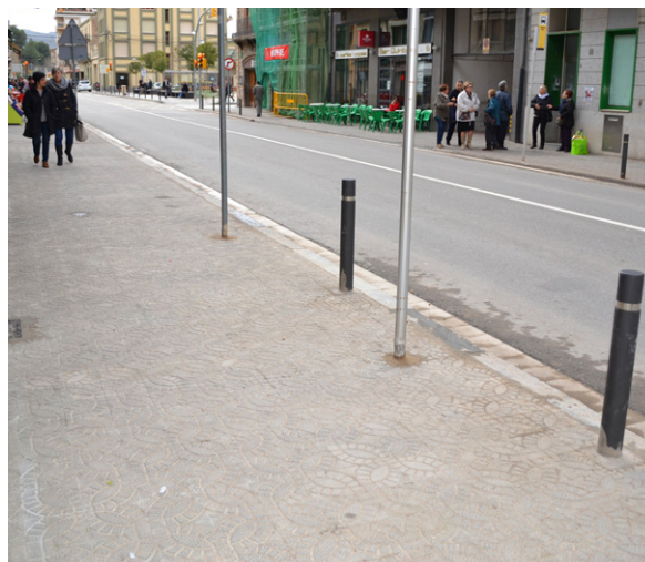
Tram de vorera renovat a la travessia principal Les millores han donat protagonisme a les persones

Al llarg d'aquest any 2015 es desenvoluparan les obres de millora del carrer Sant Antoni Maria Claret, també finançades pel pla Xarxa, per