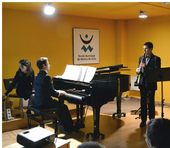
Concert al Petit Auditori de l'Escola de Música El centre ha començat a aplicar un nou model pedagògic

En aquesta nova etapa, l'Escola de Música ha incrementat la seva pre-