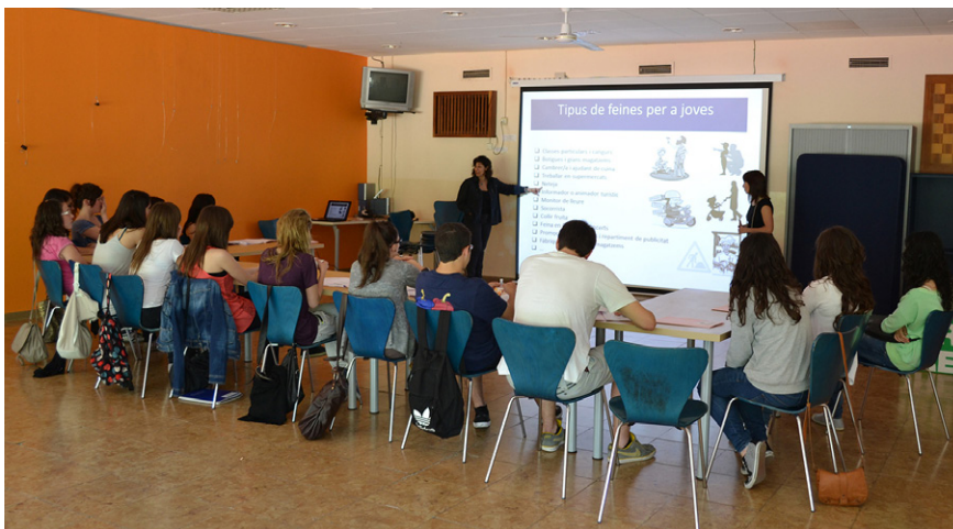
El Casal de Joves va acollir una sessió per a alumnes de l'institut Mig-Món L'acte va ser organitzat pel Club de la Feina i el Punt d'Informació Jove

Fomentar l'esperit emprenedor va ser l'objectiu principal d'un cicle de tres seminaris organitzats des de l'àrea de Desenvolupament Local, amb el suport de la Generalitat, la Diputació, la xarxa Inicia i el Fons Social Europeu. Un dels seminaris va estar dedicat al servei d'assessorament a persones emprenedores, una iniciativa dels ajuntaments de Súria, Sant Joan de Vilatorrada i Santpedor. El servei atén consultes puntuals sobre temes organitzatius o legals, a més d'oferir assessorament sobre aspectes com el pla d'empresa o l'accés a subvencions. A Súria, les consultes s'atenen els divendres, de 9.00 a 15.00 h. a la Casa de la Vila. Cal demanar cita prèvia per telèfon (93.868.28.00) o correu electrònic ( promocio@suria.cat ).