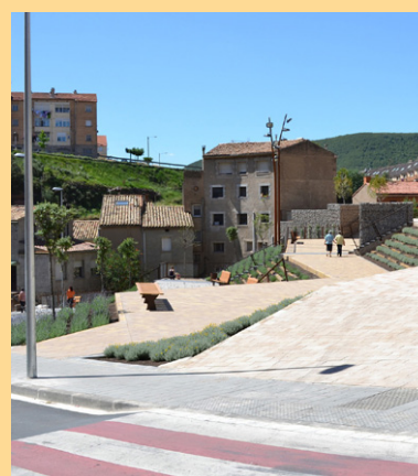
Imatge d'un dels nous espais

la calçada, construir noves voreres, habilitar passos de vianants i dignificar aquest espai urbà, creant nous recorreguts urbans entre la carretera de Sant Salvador, els carrers Campanar i Sant Cristòfol, i l'Era del Quinquar. Les obres formaven part del Projecte d'Intervenció Integral del Poble Vell-Sant Jaume, acollit al Pla de Barris de Catalunya.