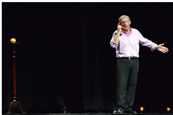
Joan Pera va oferir l'espectacle 'Joan Pera, Capri'

L'Ajuntament ha expressat el seu agraïment a totes les persones, entitats i empreses que han fet possible l'èxit de la Festa Major, donant un exemple de participació cívica que no ha deixat de banda el compromís social en aquest temps de crisi.