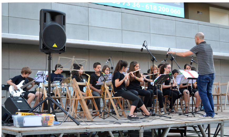
Concert de la Big Band de l'Escola de Música a la plaça de la Serradora El nou model pedagògic preservarà la línia de qualitat que ha mantingut el centre

Per què és necessari fer ara aquest plantejament? La decisió ha vingut condicionada pel difícil moment que passen les escoles municipals de música d'arreu del país a causa de la davallada de les aportacions provinents de la Generalitat, en el context de les retallades pressupostàries que pateix el conjunt d'administracions públiques. Malgrat això, cal recordar que abans de la crisi ja hi havia