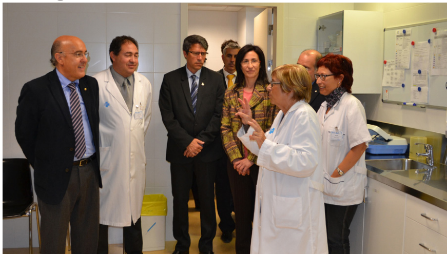
Un moment de l'acte d'inauguració de les noves dependències del CAP L'àrea bàsica de salut (ABS) de Súria dona servei a diferents poblacions del Mig Cardener