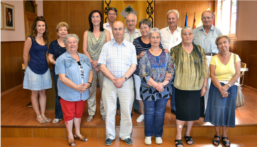
El Consell de la Gent Gran va tancar el curs en un acte a la Casa de la Vila L'alcalde i la regidora de Benestar Social van agrair tot el treball realitzat