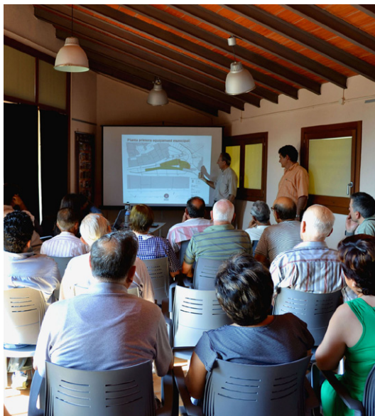
La sessió va tenir lloc a Cal Balaguer del Porxo

En l'avantprojecte també es contempla la renovació de les xarxes de clavegueram, aigua, electricitat i gas, i