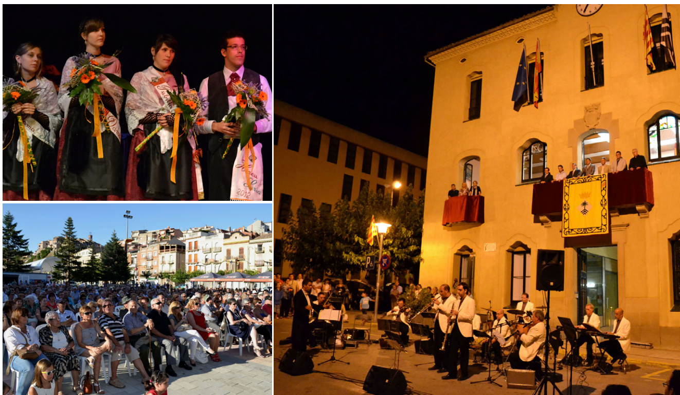
L'alta participació ha estat la nota dominant en els actes de la Festa Major, que es va celebrar del 7 al 17 de juliol Imatges de les tocadetes davant la Casa de la Vila, dels nous representants del pubillatge surienc, i del públic assistent al concert