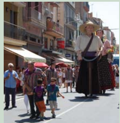
Imatge de la cercavila de la Festa Major

gada contenció pressupostària que afecta totes les administracions. Malgrat això, s'ha mantingut la gratuïtat de la gran majoria d'actes i s'ha pogut oferir un programa variat per satisfer els gustos de persones de totes les edats. D'altra banda, també han estat introduïts canvis per avançar cap a la renovació de la tradició del pubillatge, que es troba tan arrelada a la nostra vila.