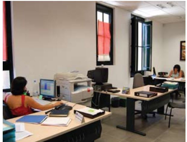
Noves dependències de Promoció Econòmica La inserció laboral és un objectiu bàsic municipal

L'Ajuntament també gestiona el desenvolupament a Súria de programes de