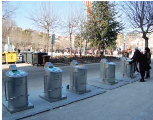
Súria ja disposa de contenidors soterrats

L'any 2008, Súria es va convertir en una de les primeres poblacions de la comarca amb una ordenança sobre la recollida selectiva. El respecte al medi també