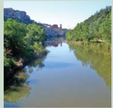
Perspectiva del riu des de la palanca

El riu Cardener configura un entorn natural de gran importància per a Súria. Durant aquest mandat s'ha desenvolupat la segona fase del projecte Riu Verd, restaurant la vegetació de ribera des de les hortes fins a pràcticament el Fusteret, a més d'altres iniciatives de neteja i restauració. Aquestes actuacions s'afegeixen a les efectuades des d'altres àrees municipals per millorar l'entorn del riu, fent-lo més agradable i accessible a persones de totes les edats.