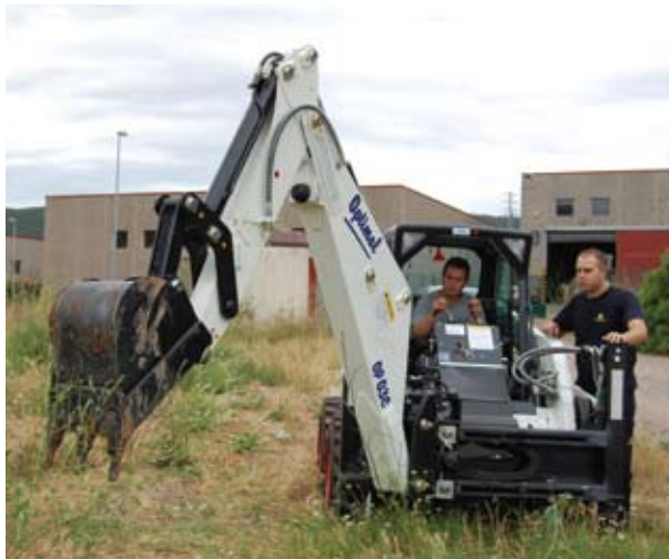
Vehicle multitasca de la brigada, en acció La dotació material del servei ha estat modernitzada

Aquestes noves tasques són una conseqüència de la major dotació de mobiliari urbà i de la vitalitat social de la vila, atès que una vessant destacada de la seva activitat consisteix en donar suport logístic a la celebració d'esdeveniments. Les altres feines bàsiques de la brigada consisteixen en tenir cura del manteniment de la via pública, endreçar els espais verds i vetllar per la bona conservació de les instal·lacions i equipaments municipals. El balanç d'aquesta nova etapa ha estat