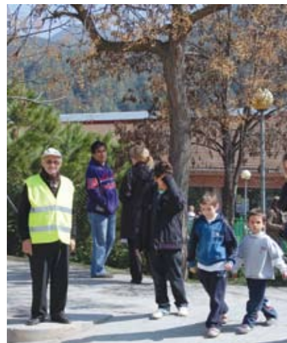
Imatge de l'acció 'A l'escola hi vaig a peu'

Des de 1993, l'Ajuntament ofereix classes de mobilitat a persones majors de 60 anys, en una mostra de la llarga trajectòria del compromís municipal amb aquest col·lectiu. Un altre exemple és la Setmana de la Gent Gran, que cada any programa diferents activitats per millorar la qualitat de vida i reforçar l'autoestima. L'alta participació registrada en les darreres edicions mostra la seva consolidació i l'interès que desperta aquesta iniciativa.