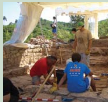
Excavació Arqueològica a les Guixeres

L'Ajuntament té la responsabilitat de vetllar per la conservació del patrimoni històric, posant-lo a l'abast de tothom com a signe d'identitat col·lectiva i capaç d'atreure un turisme de qualitat. En l'actual mandat s'ha mantingut l'esforç per consolidar Súria com un dels centres turístics de la comarca, ampliant l'oferta d'activitats al voltant del Poble Vell.