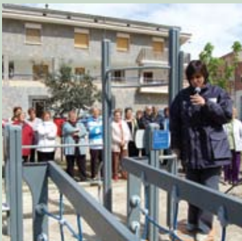
Demostració de l'ús de l'equipament

El barri dels Joncarets disposa des de mitjans de l'any passat d'un Espai Lúdic i de Salut, pensat especialment per a la gent gran. L'equipament forma part d'una xarxa que ha estat promoguda per la Diputació de Barcelona i pels ajuntaments. L'Espai Lúdic i de Salut consta de diferents aparells que permeten fer exercicis suaus de manteniment. Tot i que s'adreça sobretot a les persones grans, la utilització de l'equipament és obert a la participació de tothom.