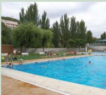
Les piscines municipals han millorat

La millora d'equipaments esportius pretén fomentar la pràctica esportiva i reforçar l'activitat de les entitats surienques que treballen en aquest àmbit. Les piscines municipals van estrenar l'estiu de 2008 una nova zona de gespa artificial i altres millores pensades per fer més acollidor el recinte, millorar la qualitat de l'aigua i facilitar la pràctica de la natació a les persones amb mobilitat reduïda.