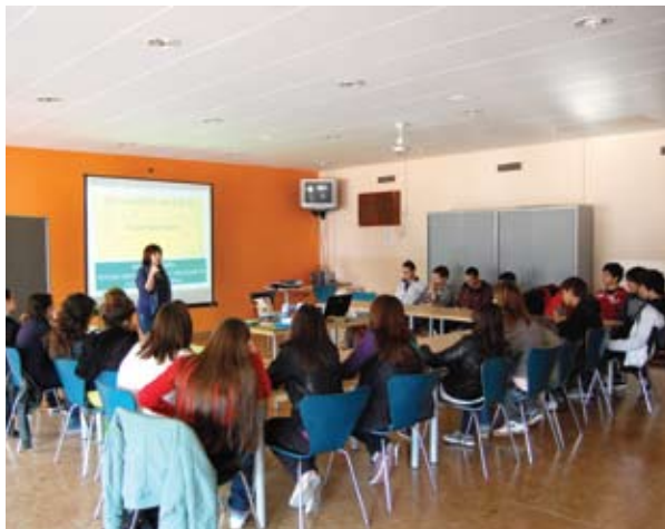
Taller sobre afectivitat i sexualitat

L'àrea de Joventut ha rebut un nou impuls amb la incorporació d'una tècnica especialitzada per tal de desenvolupar les directrius del Pla de Joventut, dinamitzant el Casal de Joves i promoure nous projectes d'informació i participació. Una de les iniciatives realitzades fins ara ha estat la descentralització del punt d'informació juvenil (PIJ) de Súria, amb la col·laboració de l'institut Mí-