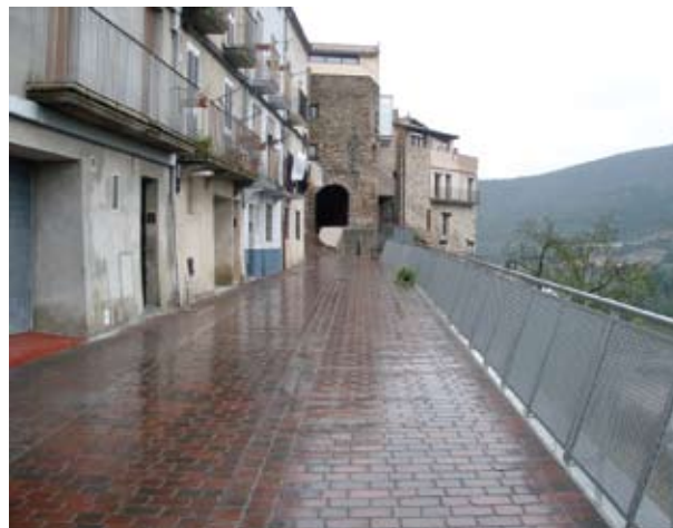
El carrer Sant Sebastià, després de les obres El Pla de Barris ha comptat un gran esforç inversor

Diferents sessions d'informació i participació ciutadana han estat celebrades per recollir, en la mesura del possible, les propostes dels veïns i veïnes dels dos barris en la planificació de les principals obres previstes.