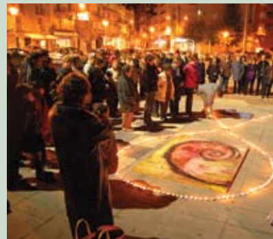
Encesa d'espelmes contra la violència

de la Casa de la Vila i l'encesa d'espelmes a la plaça de Sant Joan com a homenatge a les dones mortes per la violència masclista. En els darrers anys, el nombre d'activitats relacionades amb aquestes dues dates ha augmentat amb tallers, xerrades i activitats participatives per a homes i dones de totes les edats. L'organització d'aquests actes, que es perllonguen durant varies setmanes, compta amb la col·laboració de diferents entitats.