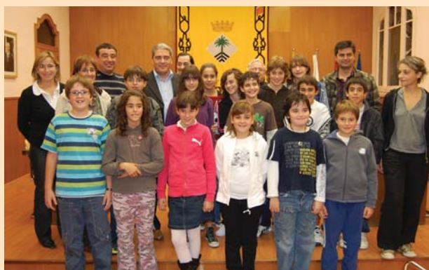
Membres del Consell, amb l'alcalde, regidors i la tècnica municipal

El Consell dels Infants va iniciar una nova etapa el passat 29 d'octubre amb la seva renovació parcial i el seu pas a l'àrea municipal d'Educació. Fins ara, aquest òrgan consultiu, format per catorze alumnes escollits democràticament pels seus companys i companyes de classe, estava adscrit a l'àrea de Serveis Socials. Durant l'últim any, el Consell dels Infants ha portat a terme accions sobre educació cívica, millora de la mobilitat i una reflexió sobre el lleure, entre d'altres activitats.