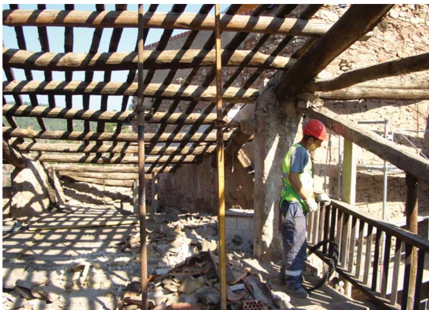
L'estructura de la coberta del Casinet, abans de ser desmuntada

Fins ara n'han estat desmuntades les dues plantes superiors i la teulada, que es trobaven en un estat de conservació molt precari. El proper pas serà la reconstrucció de les dues noves plantes, amb una estructura reforçada. L'operació de desmuntatge de la coberta i de les dues plantes superiors del Casinet ha estat complexa per la necessitat d'efectuar-la sense el suport de maquinària, per tal de no malmetre