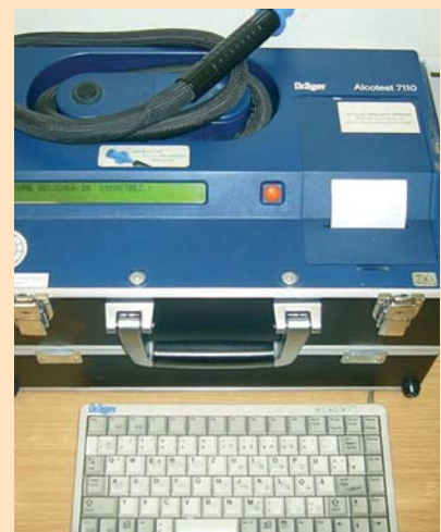
El nou model d'etilòmetre

porarà properament a la seva dotació un etilòmetre per realitzar proves d'alcoholèmia. En relació amb l'alcoholímetre que actualment utilitza la Policia Local, el nou aparell imprimeix un comprovant dels resultats, document que pot servir com a prova davant de possibles procediments judicials o administratius. Es tracta del mateix model que ja utilitzen els Mossos d'Esquadra i altres forces de seguretat.