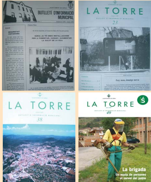
Quatre portades de diferents èpoques El butlletí va ser finalista del premi Arrel, l'any 1989

El butlletí d'informació municipal La Torre arriba al número 50 amb aquesta edició. El primer exemplar es va publicar el desembre de 1983 amb el nom Butlletí d'Informació Municipal, que es va mantenir fins al número 23. Per tant, aquest mes es compleixen 25 anys de la seva publicació ininterrompuda. Al llarg de la seva història ha modernitzat el seu disseny, adaptant-lo a les noves tecnologies. Des del seu naixement, l'objectiu ha estat informar la ciutadania sobre els projectes i accions municipals, a més de donar veu als grups representats al ple. L'any 1989 va ser finalista del premi Arrel, de la Diputació. La història de La Torre permet repassar l'evolució de Sùria al llarg d'una etapa històrica que