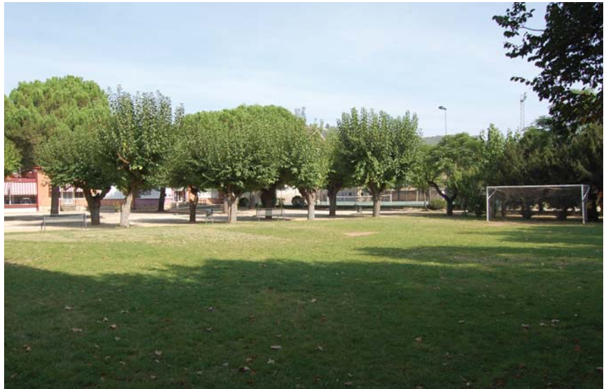
Una empresa s'encarregarà del manteniment d'espais verds La il·luminació exterior i les vies de pas també han millorat amb les obres

La connexió del servei de clavegueram amb la xarxa general ha permès eliminar el sistema de fosa sèptica que anteriorment s'utilitzava per eliminar els