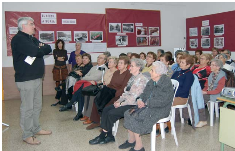
Un moment de l'acte dedicat a les vivències al tèxtil

Un dels seus actes va estar dedicat a la recuperació de les vivències personals sobre el treball a les fàbriques tèxtils surienques. Més d'una cinquantena de persones va assistir a la presentació de dues filmacions amb extreballadores del sector, complementades amb una