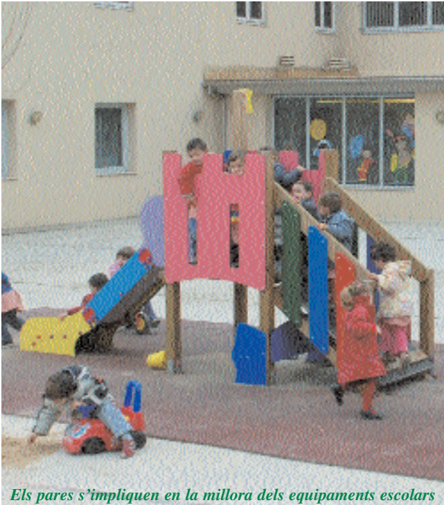
Els pares s'impliquen en la millora dels equipaments escolars