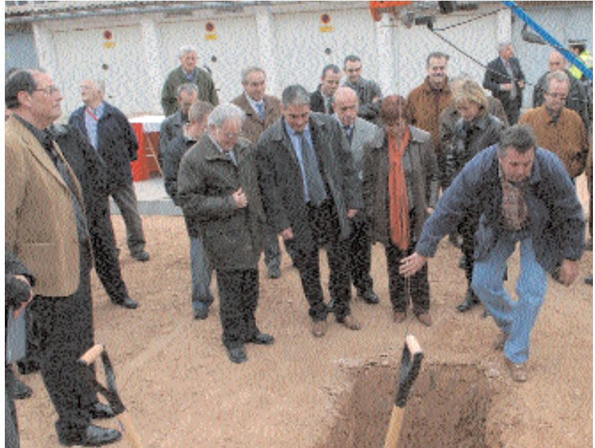
Acte de col·locació de la primera pedra

El dissabte 2 de desembre es va col·locar la primera pedra dels 33 pisos de protecció oficial, ubicats al carrer del Doctor Fleming, al barri de Santa Maria. L'Ajuntament impulsa aquesta construcció amb la col·laboració de Diputació de Barcelona, Caixa Catalunya i Proviure. 24 dels habitatges seran en règim de venda. La resta es destinaran a lloguer. La superfície oscil·larà entre els 46 i els 67 m 2 útils, tindran dues o tres habitacions i terrassa. Aquesta promoció tancarà el procés d'urbanització de la zona de Santa Maria Nord, que l'Ajuntament impulsa des de l'any 1991, per moderar el preu de l'habitatge. A finals de gener s'obrirà un període d'informació pública dels requisits i les bases d'accés i adjudicació dels habitatges, així com els terminis per poder fer les sol·licituds.