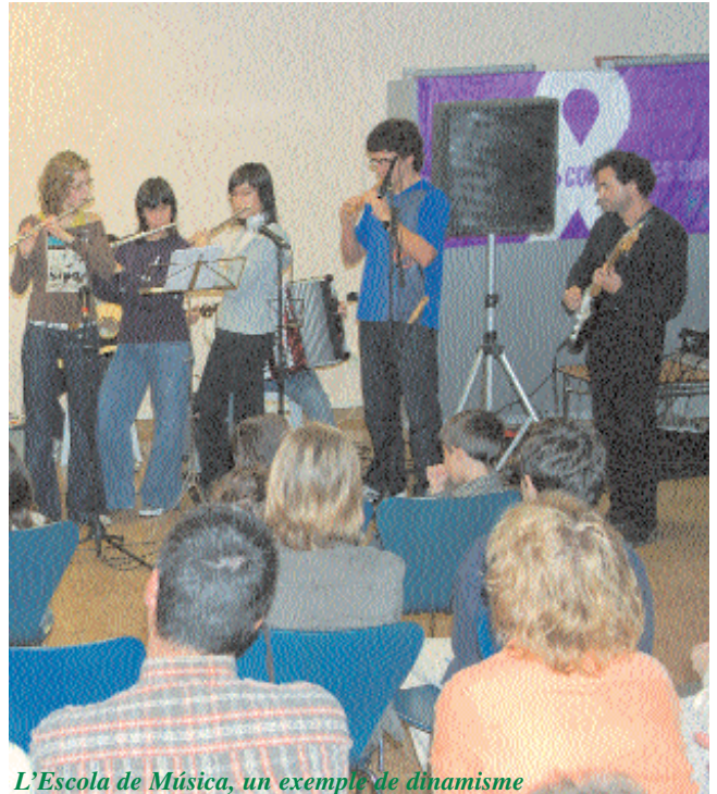
L'Escola de Música, un exemple de dinamisme

La Súria del 2006 creix en demografia i en oportunitats. Els serveis municipals s'ajusten a una realitat canviant. Els serveis socials, educatius, musicals, juvenils, posen de manifest la vocació de servei del municipi. Súria batega perquè la participació en molts àmbits és una realitat