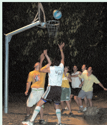
Activitat esportiva nocturna

Les activitats juvenils a la població han seguit el seu vincle d'unió amb el Casal de Joves. Per una banda, diverses entitats juvenils, com l'escola Municipal de Música o l'Institut Mig-món, han fet ús de les instal·lacions del Casal. A més a més, el Casal ha continuat el seu cicle habitual d'activitats com les diverses celebracions dels dies mundials amb activitats per a cada festivitat, els busos a teatre en col·laboració amb el Consell Comarcal i "El Galliner". A més, cal remarcar que el Punt d'informació Juvenil, situat al mateix Casal de Joves, segueix la pluja de consultes de temes tan diversos com viatges, estudis, cerca de treball o d'altres més concrets sobre hàbits salu-